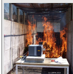
Essai en tunnel à feux au CEREN à Valabre

Les flammes issues de feu de végétation méditerranéenne atteignent et dépassent fréquemment ces températures